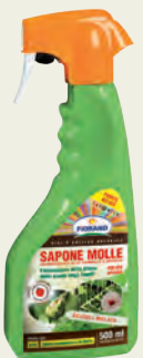
03 SAPONE MOLLE 500 ml - CORROBORANTE

Sapone ottenuto da potassa e oli vegetali, è biodegradabile e privo di fitotossicità. È utilizzato in agricoltura biologica per lavare la vegetazione infestata da afidi e altri insetti. Favorisce il dilavamento di uova e insetti nonché della melata. Sugli acari (raghetto rosso) svolge un'azione essiccante. Utile sui piante da orto e da giardino.