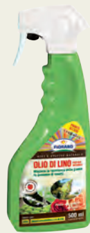
02 OLIO DI LINO 500 ml - CORROBORANTE

Olio vegetale ottenuto dalla spremitura a freddo dei semi di Linum usitatissimum precedentemente essiccati. Aiuta a migliorare le difese naturali delle piante in presenza di insetti e in particolare di cocciniglie. Consigliato in frutticoltura, orticoltura e giardinaggio.