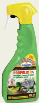
01 PROPOLIS 500 ml - CORROBORANTE

Cos'è un corroborente? Sono sostanze naturali, consentite in agricoltura biologica, che aiutano le piante, tra le altre proprietà, a potenziare la resistenza naturale dalle avversità.