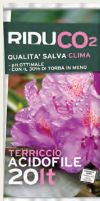
TERRICCIO ACIDOFILE 20 L