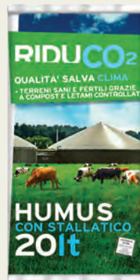
HUMUS CON STALLATICO 20 L