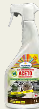
04 "ACETO" - ACIDO ACETICO 1 L - CORROBORANTE

L'aceto usato in cucina contiene normalmente un volume di acido acetico compreso fra 3-5%, mentre questo prodotto arriva ad avere una percentuale 3 volte superiore. Grazie alla sua acidità, l'aceto si utilizza come corroborente per abbassare il pH dell'acqua utilizzata in alcuni trattamenti con prodotti biologici. A contatto con le piante (es. fiori, erbe infestanti, ecc ...) esplica azione caustica, cioè ne altera in profondità i tessuti fino a bruciarli.