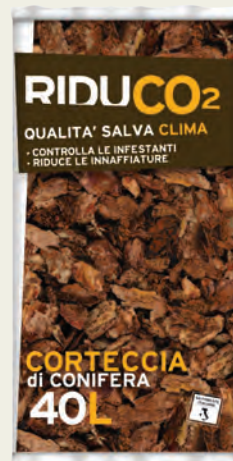
CORTECCIA DI CONIFERA 40 L