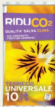
TERRICCIO UNIVERSALE 10 L

I Terricci Fiorand possono essere affiancati alle altre referenze principali del settore, per una gestione completa del comparto.