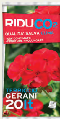
TERRICCIO GERANI 20 L